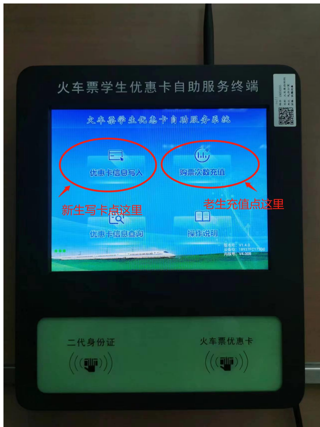
火车票学生优惠卡自助服务终端